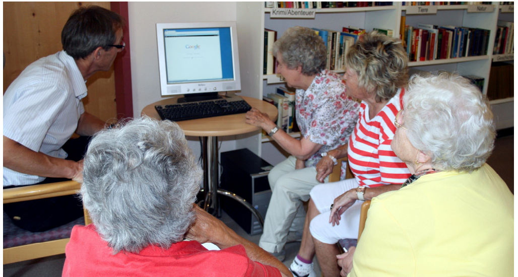
Stossen auf reges Interesse: Die Internet-Kurse im Guggerbach.

im Guggerbach? Wenn Sie einen persönlichen Anschluss wollen, kostet das monatliche unbeschränkte Surfen nur 10 Franken. Gerne werden wir Sie unterstützen und den Anschluss einrichten. Auch ohne persönliche Investition (PC, etc.) kann man - unentgeltlich - die öffentliche Internetstation im Mehrzwecksaal benutzen.