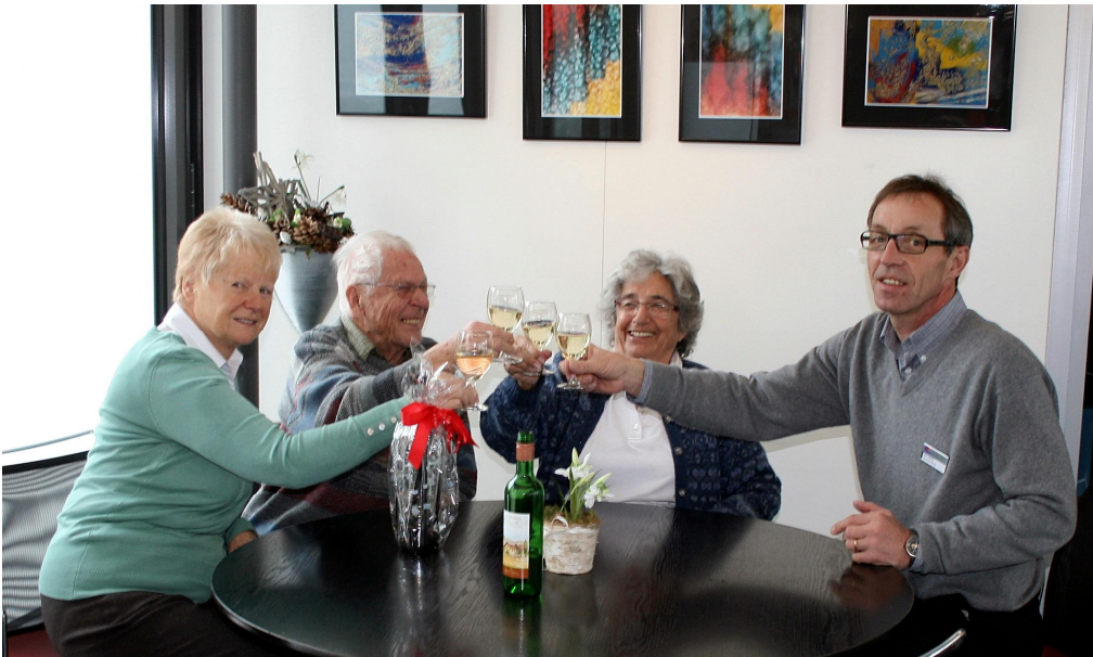
Ein Prosit auf die beiden neuen Wanderleiterinnen.

Im Veranstaltungskalender der Guggerbach-Zeitung und in der Davoser Zeitung wird die Wanderung wie gewohnt ausgeschrieben. Severin Schellenberg, vielen Dank für die Wanderleitung der vergangenen Jahre!