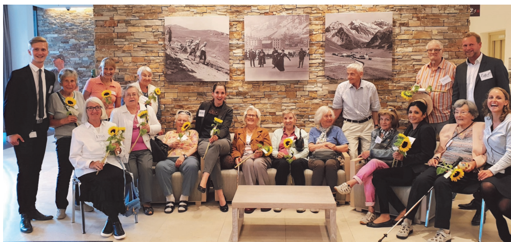
Die Guggerbach-Bewohner verbrachten einen gemütlichen Nachmittag im Hilton. Die Hilton-Kaderleute verstanden es, die Guggerbach-Bewohner zu begeistern und zu verwöhnen. Es war ein perfekter Nachmittag – danke, liebe Hilton-Crew!

Liebe Bewohnerinnen, liebe Bewohner, werte Gäste und Freunde