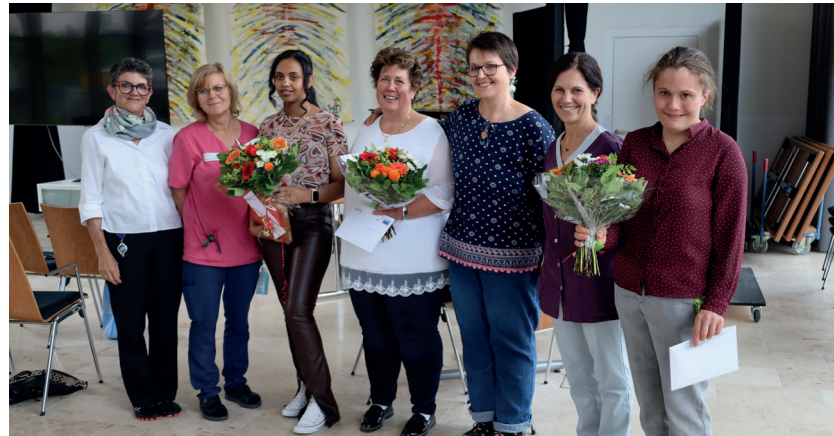
Diplomfeier unserer Lehrlinge im 2023